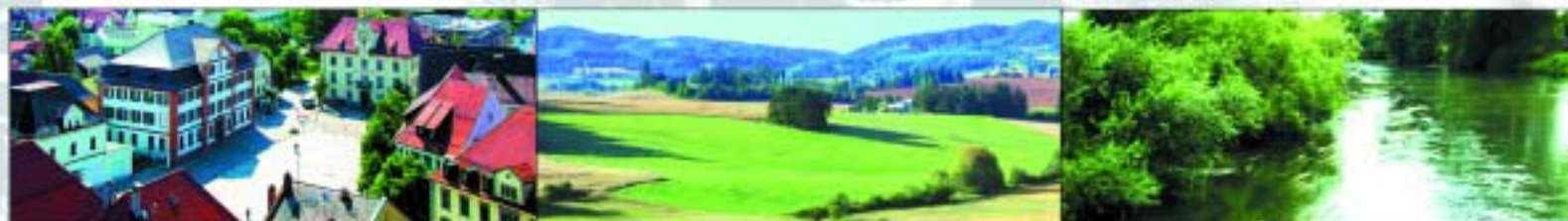
SACHS marketing & sales promotion

La piste de randonnée cyclable du Danube traverse Ebingen et transforme cette ville en destination et site intermédiaire idéal. Le vaste réseau de pistes cyclables, intégré aux merveilleux paysages d'une grande diversité du Jura Souabe, métamorphose toute randonnée en événement marquant. Vallées entourées de monts abruptes ou plateaux panoramiques, le Jura Souabe confère une expérience inoubliable à chaque amateur de la nature. La ville d'Ebingen sur les rives du Danube, située sur la route du baroque de la haute Souabe, est un lieu de prédilection pour les amateurs de cultures désireux de découvrir ses nombreuses constructions du baroque précoce et tardif. La gastronomie d'Ebingen mérite une attention particulière. Vous pouvez vous délecter à cœur joie. Qu'il s'agisse de cuisine souabe ou internationale, la grande diversité est faite pour réjouir tous les palais. Nos restaurants, bistrotts et bars vous accueillent avec la célèbre hospitalité souabe. Et comme nous savons parfaitement qu'un jour à Ebingen ne saurait suffire, nous vous proposons d'innombrables possibilités de nuitées à Ebingen et dans ses alentours. ( www.ehingen.de/gaestezimmer )