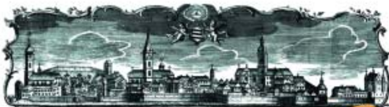
Ancienne vue de la ville d'Ebingen représentée par une gravure sur cuivre de 1740