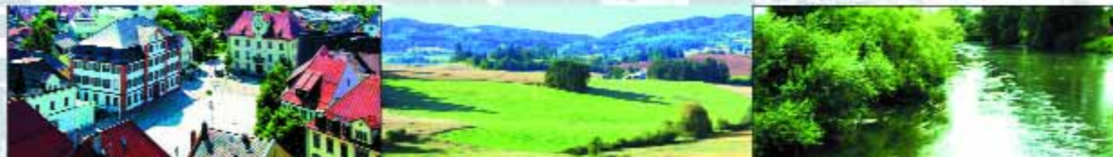
SACHS marketing & sales promotion

A pretože je jeden deň pre Ehingen vlastne málo, nájdete v Ehingene a jeho okolí mnoho možností na prenocovanie. ( www.ehingen.de/gaestezimmer )