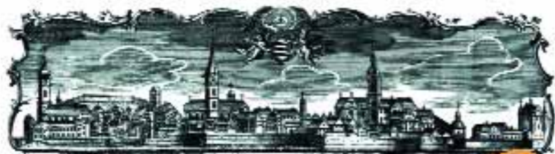
Najstarší pohľad na mesto Ehingen podľa medirytiny okolo roku 1740