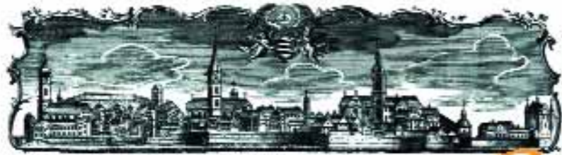
Ebingen városának legrégebbi ábrázolása egy rézkarcon (1740 körül)