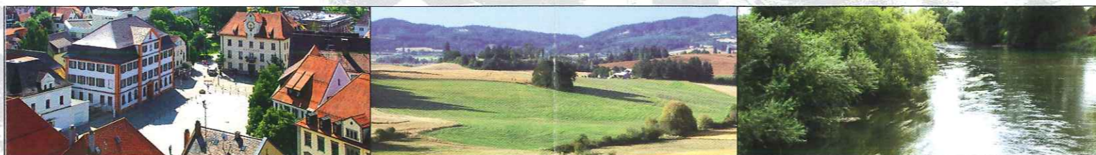
SACHS marketing & sales promotion

尤其值得一提的是埃因根的餐饮业，在这里，您能品尝到心爱的食品。无论是地道的施瓦本特色餐还是国际化的烹饪手艺，花样繁多的佳肴会令每一位美食家流连忘返。我们的饭店、小餐馆和酒吧用闻名遐迩的施瓦本式的殷勤好客来款待您。如果在埃因根逗留一天远不能使您尽兴，那您可以在埃因根市内和周围地区的许多酒店和宾馆中择一而栖。(www.ehingen.de/gaestezimmer)